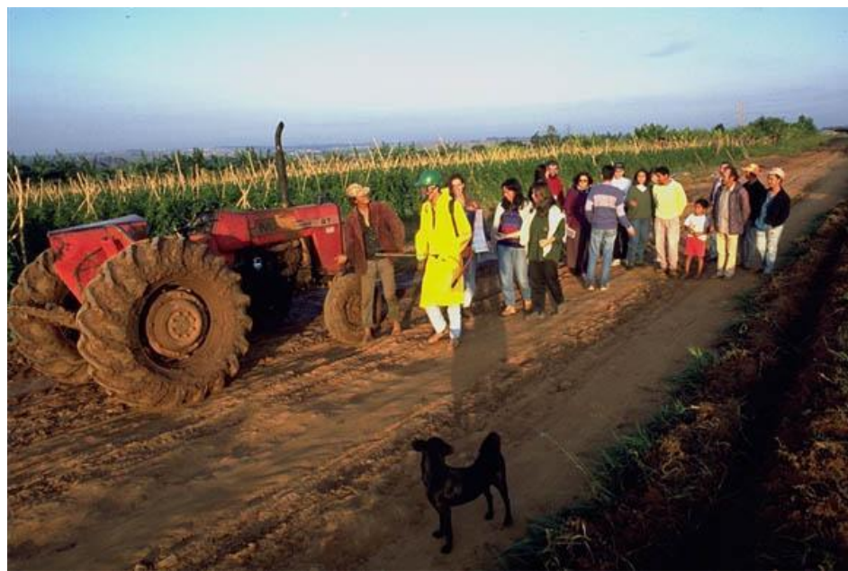
Figura 4 - rabitur posuere quam vel nibh. Cras dapibus dapibus nisl.

lorem. In porttitor. Donec laoreet nonummy augue. Suspendisse dui purus, scelerisque at, vulputate vitae, pretium mattis, nunc. Mauris eget neque at sem venenatis eleifend. Ut nonummy. Fusce aliquet pede non pede. Suspendisse dapibus lorem pellentesque magna. Integer nulla. Donec blandit feugiat ligula. Donec hendrerit, felis et imperdiet euismod, purus ipsum pretium metus, in lacinia nulla nisl eget sapien.